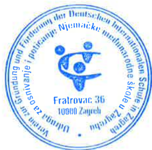
Turid Schneider-Helmholz Predsjednica udruge